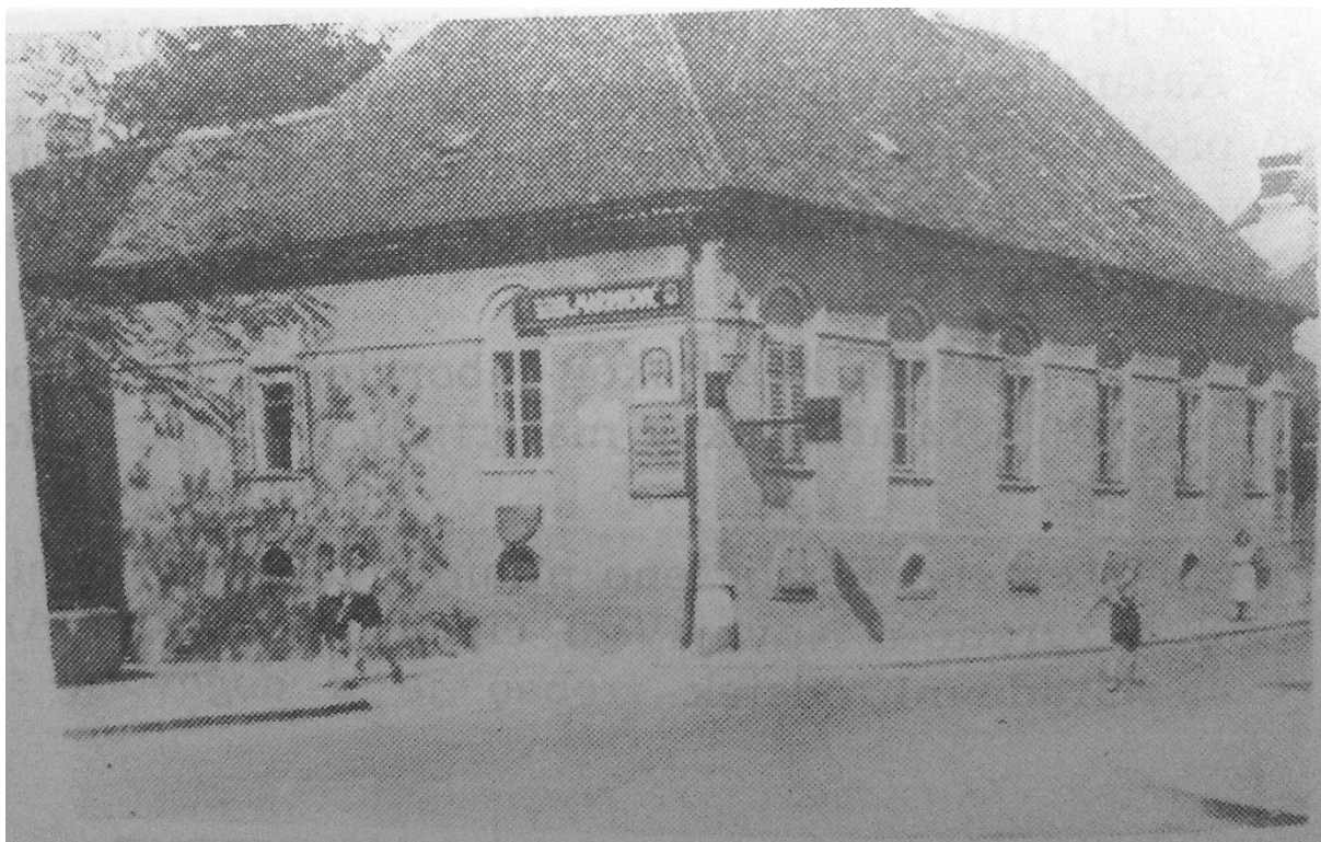
SLIKA 2. Zgrada prvog kemijskog zavoda Sveučilišta u Zagrebu u Novoj Vesi br. 1 [3]