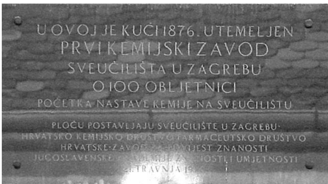
SLIKA 3. Spomen ploča na zgradi u Novoj Vesi broj 1 u Zagrebu, u kojoj je bio smješten prvi sveučilišni kemijski laboratorij u Hrvatskoj [5]

Kako bi se opremio kemijski laboratorij bilo je potrebno sastaviti troškovnik za potreban pribor i izvođenje potrebnih radova. U tu svrhu prof. Veljkov, u prosincu 1876. godine, odlazi na put u Beč da pribavi potreban pribor i materijale. Također 1877. godine odobrava se donacija za nabavu pribora i kemikalija za novonastali kemijski laboratorij. Kao