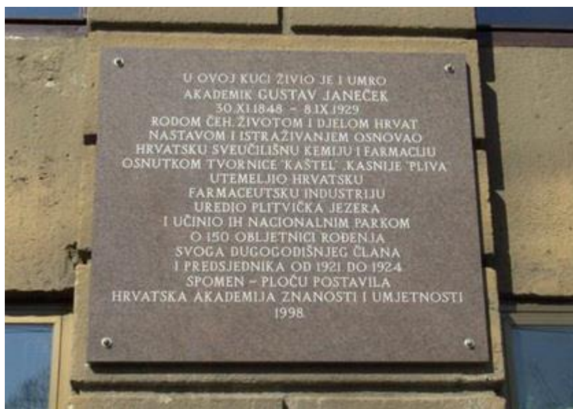
SLIKA 12. Spomen ploča u Janečekovu čast na njegovoj kući na Trgu kralja Tomislava u Zagrebu [1]

U čast Janečeku, 1998. godine, povodom 150 godišnjice njegova rođenja postavljena je spomen-ploča na Janečekovoj kući na Trgu kralja Tomislava u Zagrebu. Spomen ploča je prikazana na slici 12.