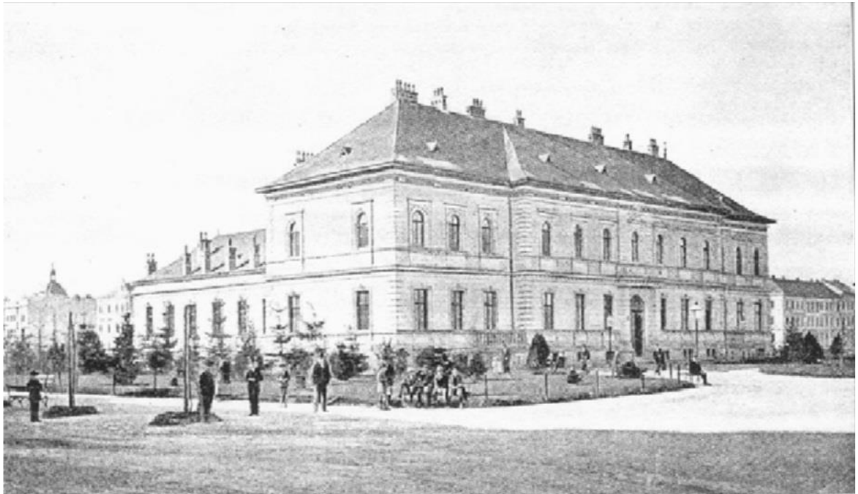
SLIKA 5. Zgrada Kemijskog zavoda na Strossmayerovom trgu br.14 dovršena 1884. godine [5]

za bogoštovlje i nastavu. Iznajmljeni prostor kemijskog zavoda u Novoj Vesi službeno je otkazan u rujnu 1883. godine. Nova zgrada izgrađena je u travnju 1884. godine a u svibnju je Gradsko poglavarstvo izdalo stambenu dozvolu za novoizgrađenu jednokatnu zgradu u kojoj je smješten kemijski laboratorij. [3] Nova zgrada Kemijskog zavoda prikazana je na slici 5.