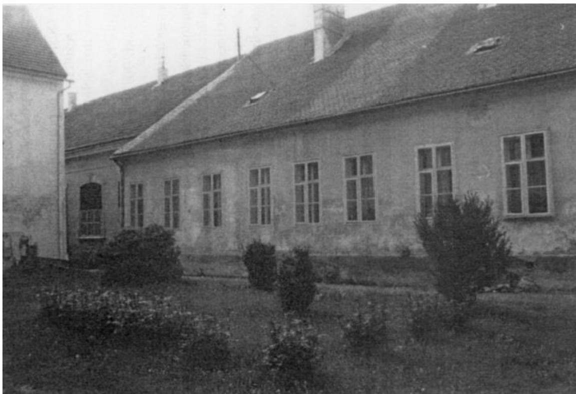
SLIKA 1. Kemijski laboratorij Kraljevskoga gospodarskoga i šumarskoga učilišta u Križevcima [5]

Značajan razvoj kemije popraćen eksperimentalnim istraživanjima i znanstvenim radovima započinje tek nakon utemeljenja prvog Kemijskog zavoda na Sveučilištu u Zagrebu koji je utemeljen 1876. godine. Tada je započelo najvažnije razdoblje za kemiju u Hrvatskoj u 19. stoljeću. Iz tog razdoblja dolaze najvažnija saznanja i istraživanja iz kemije, te najistaknutiji kemičari u to doba.