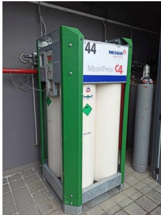
Slika 9. Spremnik argona koji je potreban za rad ICP-MS uređaja

analize ne bi ponestalo. Na slici 9. je prikazan spremnik na kojem se može očitati količina preostalog argona.