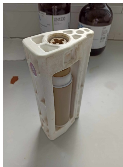
Slika 6. Teflonska kiveta fiksirana u okvir

Nakon što su učvršćene u okvir, teflonske kivete se stavljaju u mikrovalni uređaj Milestone prikazan na slici 7., koji ih je zagrijavao 40 minuta. Temperatura u kućištu mikrovalnog uređaja se tijekom zagrijavanja podigne na oko 60 °C, dok je temperatura unutar teflonskih kiveta podignuta do 210 °C. Slika 8. prikazuje ekran na mikrovalnom uređaju Milestone pomoću kojega se u svakom trenutku digestije može pratiti temperatura unutar kiveta i uređaja. Nakon