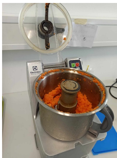
Slika 4. Uzorak mrkve u mlinu nakon mehaničkog usitnjavanja

Prilikom prenošenja uzorka iz plastične vrećice u teflonsku kivetu na vagi, mora se koristiti plastična žlica – korištenje metalne žlice može kontaminirati uzorak metalima te na kraju dati netočan rezultat. U teflonske kivete se odvaže 0.45 - 0.55 grama uzorka. Treba paziti da uzorci budu na dnu kivete, a ne na stjenkama kivete. Između svakog vaganja potrebno je čistiti pribor za odvagu, a ako se odvaže previše uzorka u kivetu, ostatak koji se izvadi van se baca. Ove mjere osiguravaju točnost i preciznost mjerenja. Teflonske kivete se označe brojevima kako bi se uzorak mogao pratiti tijekom analize. Prva dva uzorka sadrže samo uzorak mrkve, dok je u