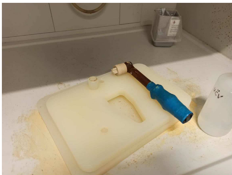
Slika 5. Postolje i odvijač kojim se teflonske kivete fiksiraju u okvir

Priprema uzoraka za mikrovalnu digestiju – Uzorcima u teflonskim kivetama dodaje se 7 mL koncentrirane dušične kiseline i 1 mL vodikovog peroksida (30 %). Ovaj postupak vrijedi za uzorke hrane za ljude, hrane za životinje i vode. Zatim se pričekava nekoliko minuta da se odvije reakcija između dodanih tvari i uzorka. Nakon što se odvila reakcija digestije organskih tvari pomoću dušične kiseline i vodikovog peroksida, kivete se fiksiraju u okvire pomoću čepa i odvijača. Pri fiksiranju kivete u okvir, radi stabilnosti se postavljaju u postolje vidljivo na slici 5. Slika 6. prikazuje kivetu koja je fiksirana čepom u okvir.