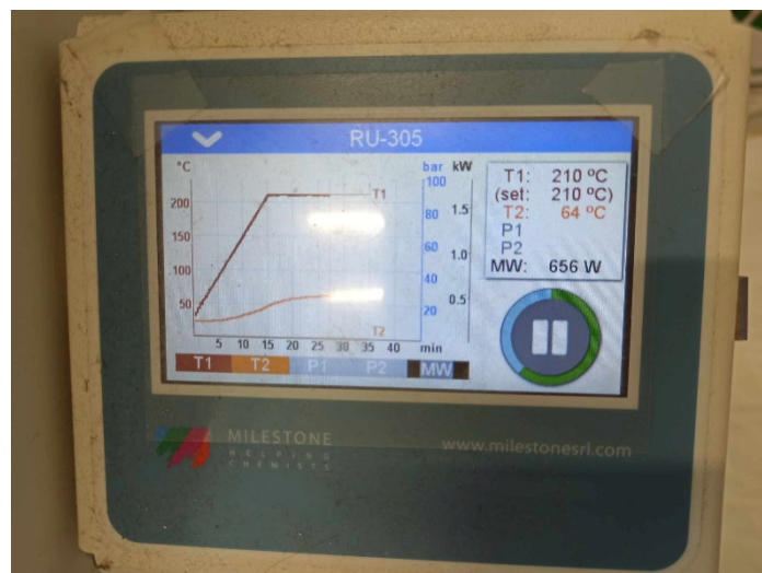
Slika 8. Grafički prikaz temperature i vremena u mikrovalnom uređaju Milestone