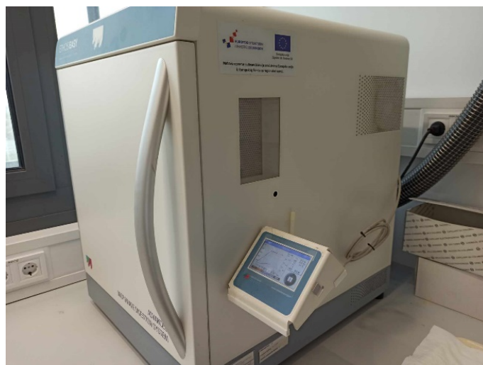
Slika 7. Mikrovalni uređaj Milestone

zagrijavanja treba ostaviti uzorke da se ohlade do sobne temperature. Nakon hlađenja uzorci se prenose u plastične posude Falcon od 50 mL. Teflonske kivete se ispiru deioniziranom vodom kako ne bi zaostao uzorak. Deionizirana voda u teflonskoj kiveti prenese se u plastičnu posudu s uzorkom. Uzorak se nadopuni vodom do oznake od 50 mL. Bitno je označiti plastične posude tako da je poznato u kojoj se posudi nalazi određeni uzorak.