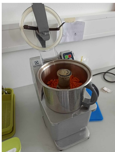
Slika 3. Uzorak mrkve u mlinu prije mehaničkog usitnjavanja

Uzorak se prvo stavi u mlin, gdje se mehanički usitni kako bi odvaga i prenošenje u teflonske kivete bila lakša. Slike 3. i 4. prikazuju mlin u kojem se uzorak mrkve mehanički usitnio iz duguljastih komada u sitne komadiće. Uzorak se zatim prenese u čistu plastičnu vrećicu i važe. Prije vaganja bitno je kalibrirati analitičku vagu radi maksimalne preciznosti mjerenja.